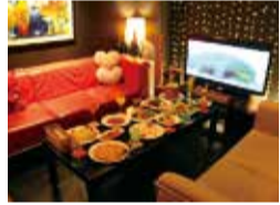
(上)asiaの女子会プラン(本日の前菜3種盛り/季節のサラダ/マルゲリータピザ/asiaの唐揚げ/本日のパスタ/本日のデザート)。

オープンから20年以上、苦楽園で愛されるダイニングカフェ。この春、オススメしたいのが、おトクな女子会プラン。毎日、シェフが市場から仕入れる旬の食材を使ったヘルシーな前菜やサラダなど、ココロときめく創作料理が並ぶ。2~10名までOKのカラオケ付個室は、小さな子ども連れでも気兼ねなく楽しめる評判!