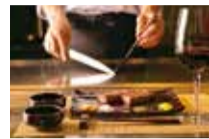
歴史に裏打ちされた確かな技術で、特別なひとときを演出。

明治18年から神戸牛を扱い130年以上の実績を持つモーリヤ本店。今回、モーリヤこだわりの厳選牛を使用した絶品ステーキが味わえる「シティライフ限定コース」が登場!充実のボリュームをおトクな料金で提供!石と木目を基調とした風格ある店内で極上のステーキコースを楽しもう。