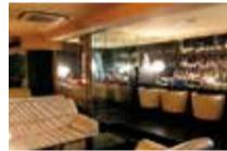
雰囲気の良い店内は、すべてソファ席のためゆっくりと食事を楽しめる。

特典 「シティライフを見た」で ●スタンダードプラン ..... 通常4,500円→3,500円 (4月末まで、個室利用はコースのご注文のみ)