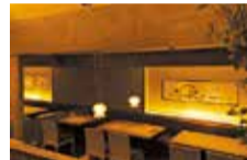
京町屋風の落ち着いた店内は座敷や掘りごたつなど全68席。個室もあるのが女子会にピッタリ!

市場から直接仕入れる新鮮な魚介類を贅沢に盛り込んだランチ「おばんざい お魚十菜膳」がオススメ。旬の魚を造り&焼き&揚げ物で味わう。他にも、煮物や蒸し物など、たくさんの料理を少しずつ楽しめるので女性人気が高い。西宮北口駅をおりてすぐなのでアクセスも良い。おトクな読者特典で自慢のランチを楽しんで!