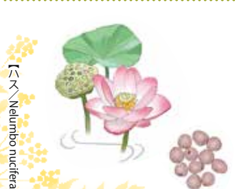
【ハス Nelumbo nucifera 】

苓白朮散」という処方 は、四君子湯がベースにな ってサンヤク・ヘンズ・ヨク イニン・レンニクとシユクシ ヤ・キキヨウを加えたもの で、下痢を起こしやすい 方や胃腸が弱い方で慢性 的にお腹をこわしやす い時、受験期や仕事でスト レスが強い時期などに使 うことができます。 不安や戸惑いを感じる 昨今、足もとの草木の芽 生えや露の臺を見ると、 その健気さに励まされる