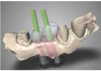
コンピュータでインプラント上部構造をデザイン。当院はAIと光学スキャナーで、従来よりも精密で、通院回数や治療時間を減らせる治療が可能になります。

ントを作った方が良いので す。矯正とインプラント 治療の両方を高いレベル で行うことができるク リニックの方が、インプラ ント治療が長期間安定 する、ということを知っ て欲しいです。