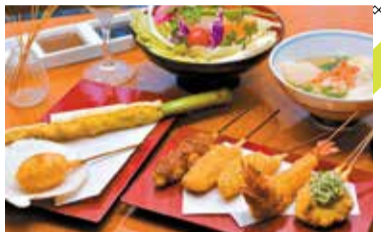
(上)平日限定ナポリセット2,490円。串揚げ7種、名物揚げ餅入りだし茶漬、生野菜、デザート。 (下)串揚げ料理マルコポーロ