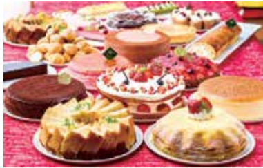
ケーキやゼリーに和菓子まで約30種のスイーツが勢揃い!!