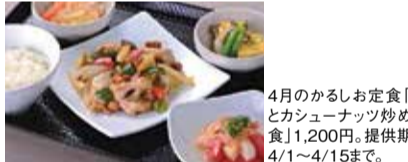
4月のかるしお定食「鶏とカシューナッツ炒め定食」1,200円。提供期間4/1~4/15まで。