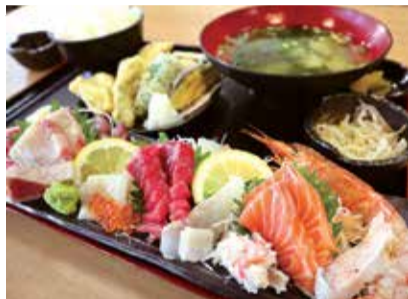
写真は「特選お造り定食」(1,780円)。その日のオススメ鮮魚をこれでもかとお造りに!