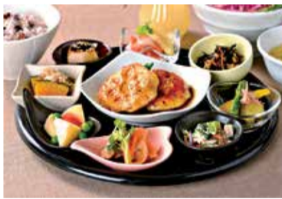
品数豊富でバランスよく食べられるKENTOヘルシーセット1,250円。ごはんは雑穀米と白米が選べる。