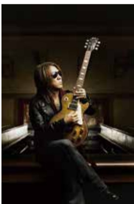
B'z松本孝弘さん。2017年には地元で凱旋ライブを開催。

松本さんは1961年に豊中市に生まれ、1988年にB'z(ビーズ)を結成しメジャーデビュー。1998年にはアルバム「Pleasure」が国内史上初の売り上げ枚数500万枚を突破、2011年にはアルバム「TAKE YOUR PICK」が第53回グラミー賞を受賞するなど、国内外において数々の功績を残している。松本さんは同市へ積極的にかかわりを持ち、2018年に