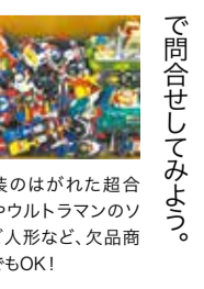
塗装のはがれた超合金やウルトラマンのソフビ人形など、欠品商品でもOK!

買取専門店 使わなくなった子ども用教材やおもちゃ、ゲームなどが自宅に眠っているなら、無料で出張買取をしてくれる「トレジャー」に相談するのがオススメ!年間50万円以上の買取実績を誇り、使用済みや欠品のある教材でも査定OK。古いゲーム機やソフ