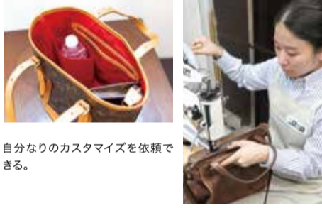
自分なりのカスタマイズを依頼できる。

思い出の物を蘇らす修理のプロ information 靴専科は靴はもちろん靴の修理、色補正など作業の殆どを店内で行う。リメイクをやっているのは市内でも珍しい。