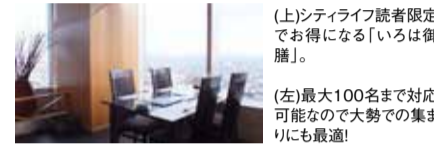
(上)シティライフ読者限定でお得になる「いろは御膳」。 (左)最大100名まで対応可能なので大勢での集まりにも最適!

旬の野菜や魚などを和食の繊細さと創作の大胆さで美味しく提供してくれる「いろは御膳」。7/1~は豚バラ竜田の玉葱サラダのせや海老すり身のロールキャベツ、鶏の味噌漬け焼・大根餅添えなど全8品が並ぶ。TV番組の料理コーナーで紹介されたこともあるこれらの料理を市役所15階から見える絶景を眺めながら食べると格別!「いろは御膳」は読者特典で500円引きの2,300円で愉しめて、さらにプラス500円でミニ天ぶらがついてくる嬉しいサービスもあり。この機会にぜひ訪れてみよう。