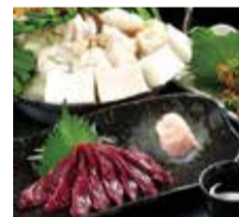
(上)とびっきり新鮮なホルモン。 (左)ひと味違う馬刺しを食べたらきっと驚かす。

じっくり4時間かけて仕上げるダシと、コーゲンたっぷりの新鮮ホルモンが相性抜群の絶品もつ鍋。そして、熊本から直送しているさっぱりあっさり馬刺しが「みつ澤」の看板メニュー。今ならこちらをテイクアウトしてお家で楽しめる!しかも、期間限定の読者限定割引が適用されて、もつ鍋全セットは、なんと500円引きというから驚き。もつ630円、めんたい400円、桜ぎょうざ490円など単品でのオーダーもOK!なかなか再現できないプロの技が光るもつ鍋を、お家でおいしく味わえるこのチャンスを見逃さないで!