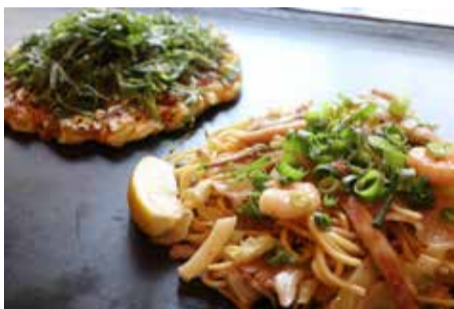
上) 人気No.1のMIX塩焼きそば(990円)と好評につき限定メニューから定番メニューになった豚しそ玉(880円)。豚しそ玉はゆずのソースが塗られているのでさっぱりとした味わい。 左) たこ焼き、明石焼ともにダシが効いているので、ソースがなくても食べられる。