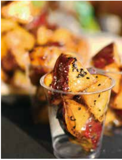
毎年人気で、遠方からまとめて買いに来るお客も多い。これからの季節におすすめ。その他にもスイートポテトや焼きいもも人気。