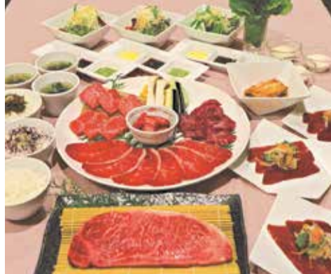
牛も肉の生ハム、白菜キムチ、グリーンサラダ、国産牛サーロイン、和幸コース、カルビ、ハラミ、赤身ロース、和牛切り落とし、焼き野菜、チヤ菜、Aのご飯(白ご飯orじゃこご飯or紫蘇ご飯)、スープ、ミニアイス ※写真は3人前 ／ Menu