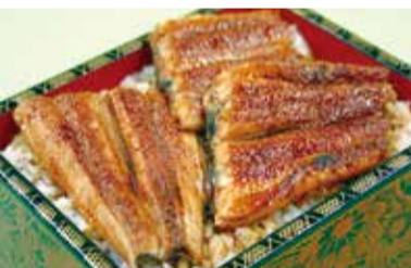
1,800円～食べたいうなぎの量に合わせて選べる。お釣りが細かからないので、配達をお願いしやすい。