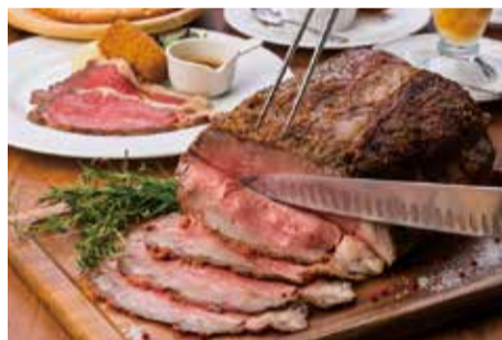
広々ゆったりとした店内or大窓を全面開放したオープンテラスで乾杯!!