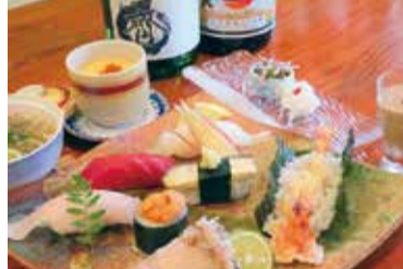
(先付け) 鱈ざくと鰻おとし、(握り) ウニ、本マグロ、カンパチ、イサキ、車エビ天ぷら、甘鯛昆布じゆめ、水茄子、(蒸し物) 豆乳茶碗蒸し、(締め) 鰻出汁にゅうめん、(デザート) 手作りわび風味ほうじ茶プランマンジェ