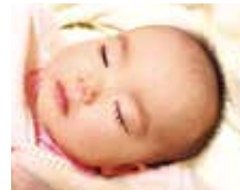
数多くの妊娠実績あり。喜びの声など、詳しくはHPで。

煎じ薬、粉薬の調合も行う北摂でも数少ない漢方専門薬局。子宝相談は評判で同店の得意分野。とりわけ内膜や卵の質の分野では噂を聞き、東海や関東からも来局される。高齢の方も多く、妊娠した4人に1人が40代という。細かく時期や体調を見ながら、「今」必要な漢方で体を整えていく。精子数、運動率の改善実績も豊富で、自然での妊娠を希望されている方にも心強い。