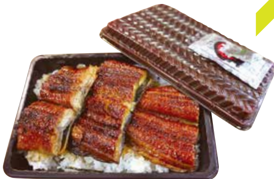
うな重弁当はそのまま電子レンジOK!

編集部おすすめの美味しいグルメ店で夏を乗り越えよう!新型コロナの影響で始まったテイクアウトメニューもおすすめ。