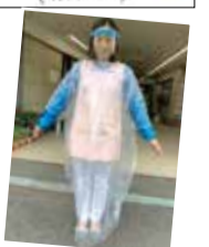
事務所内で製作した防護服とフェイスシールド。