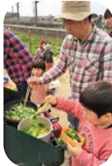
採った野菜は子どもと一緒に調理。8月はナス、オクラなど夏野菜が中心。運が良ければスイカも食べられるという。