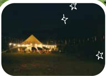
貸切BBQの夜の様子。開放感がありながらも幻想的!

デッキの木材は地元・豊能のものを使い、布団や畳などは国産にこだわった和グランピング。