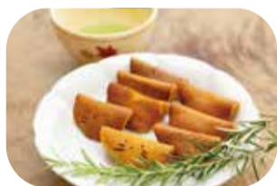
9月は和菓子を。どら焼きは生地をホットプレートで焼いて、最後にパーペキュアの鉄串を熱して、かわいい猫ちゃんの焼印に。