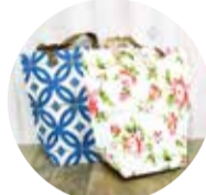
エコバッグ: 1個1,000円(税別)+壁紙代

国内外から数万種以上、様々な柄・素材の壁紙が集まる専門店。「壁紙が持つ可能性をまずは気軽に実感してほしい」と、子どもと一緒に楽しめるワークショップを行う。店内の壁紙から好きなものを買って、封筒やトレーといった小物から掛け時計、エコバッグなどが製作できる。自分で選んだ壁紙で作る世界で一つだけのアイテムは一層愛着が湧きそう!