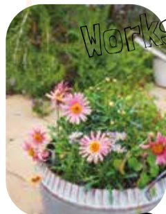
花育レッスンの仕上がり(イメージ)。