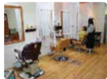
家族で通う方も多い心地よい空間。ゆったり癒されて。