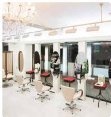
窓から気持ちの良い日差しが降り注ぐ明るく居心地の良いプライベートサロン。「ボリュームが出にくい」といった中高年特有の悩みにも幅広い提案力で悩みを解消してくれる。「キレイになってほしい」という想いと、それを可能にする確かな技術に定評あり。

BEBOOLE (ビブール) 吹田市山田南30-18 ディアコートミキ2F 営/9時半~19時 月曜定休 予約優先制 ☎06-6318-6100