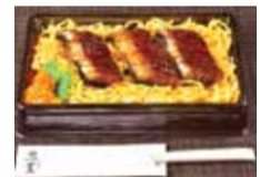
テイクアウトのうなぎ弁当。8月2日は事前予約がベター。