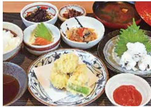
活めはも定食 [はもの湯引き、はもの天ぷら、小鉢3種、ごはん、味噌汁、香の物]