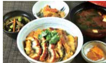
うなとじ井定食 [うなとじ井、小鉢2種、味噌汁、香の物]