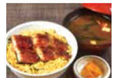
うなぎ井セット[錦糸卵入りうなぎ井、味噌汁、香の物]

本当に旨い魚をリーズナブルに食べたいなら、地元常連客に人気の一豊へ。鱧のシーズン真っ盛りの今、ボリューム満点の「活めはも定食」が大人気!新鮮な活け鱧を丁寧に店内で骨切りし、湯引きと天ぷらの両方で愉しめる。さらに8月限定で、鹿児島産・特大サイズの厳選うなぎ蒲焼を使用した定食とテイクアウトがおすすめ。「うなとじ井定食」は、注文を受けてから卵2個を使ってとじたどんぶりに小鉢もついて嬉しい。「うなぎ井セット」は肉厚にカットしたうなぎ蒲焼が3枚のった定番!間違いなし!イチバン!のおすすめ。お家でもお店の味が愉しめる「うなぎ弁当」と充実。8月2日の式の丑は一豊のうなぎメニューでさまり!