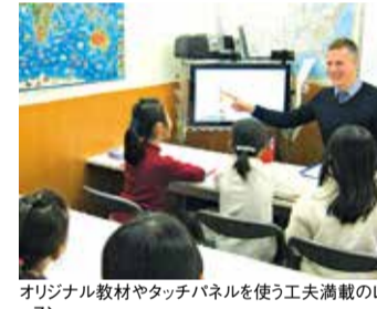
オリジナル教材やタッチパネルを使う工夫満載のレッスン