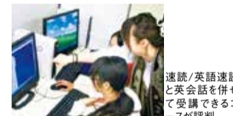
速読/英語速読と英会話を併せて受講できるコースが評判。