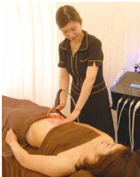
左) 経験豊富なエステシャンが多く在籍しているので安心。 下) 一人ひとりに合った効果のあるメニューを相談しながら作っていく。

定期的な社内コンテストで常に技術の向上に取り組んでいる同店のメニューは、本気で痩せたい人にこそオススメ。