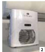
2. 東京都の救急車に設置率100%の高除菌空気清浄機O3 PREMIUMでしっかりウイルス対策。「換気するより安全」と言われるほどの殺菌力。