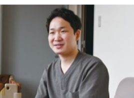
「初診時は、必ずエビデンスに基づいた説明をします。しっかり理解・納得したうえで病院にいただくようにしています。」