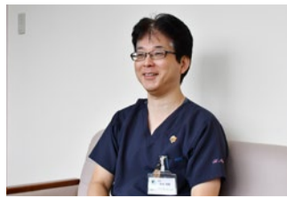
「患者さんはみなストレスを抱えて来院しています。それ以上のストレスを与えないようにお話しすることを心がけています。」