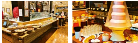
(上)サルヴァトーレ・クオモ氏プロデュースの本格ピッツァも食べ放題。 (左)感染対策もしっかりと行い、安心安全にbuffetが楽しめる。 (右)お子さまにも大人気のチョコレートファウンテンも!

ナポリピッツァを日本に広めた功労者、サルヴァトーレ・クオモ氏がプロデュースする本格ピッツェリア&バル。ナポリピッツァをはじめ、小皿料理やアンティパストはデリバリーでも楽しめる。今回、大好評のランチbuffetがリニューアル。焼きたてのピッツァやパスタ、前菜、スープ、デザートが食べ放題。「D.O.C」〜ドック〜(世界コンペ受賞ピッツァ)または牛ハラミステーキが一枚つく「プレミアムbuffet」もおすすめ!