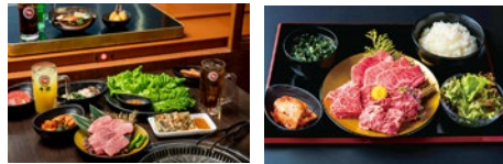
商品のプロの目で直接仕入れた、鮮度抜群なお肉は旨味たっぷり。 商品はレーンでお届け。コロナ禍で店員との接触も最小限に。 ランチは979円〜、上質国産牛を愉しめるメニューまで。

OPENから半年、お一人様から家族連れまで早くもリピーター続出の焼肉店。問屋直送だからこそ、「リーズナブルに美味しい肉が食べられる!」と評判になっている。ランクの高い黒毛和牛から、子どもが喜ぶメニューまで豊富なラインナップが並ぶ。広々と清潔感がある店内は、一席一席がゆとりある空間。さらに焼肉無煙ロースターで約3分間で客席全体の空気を入れ替え、コロナ対策も万全なので安心。大人も子どもも、美味しく楽しめること間違いなし!