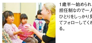
1歳半～始められ、担任制なので一人ひとりをしっかり見てフォローしてくれる。