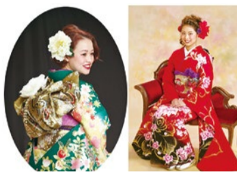
前撮り8ポーズプラン 8画像付