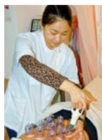
弱った内臓を刺激して自律神経や婦人科系疾患、ストレスなどにも効果のある吸玉

指や掌、肘を使った様々な手技を用いた施術を得意とする「楽楽堂」。普通の整体マッサージとは違い、全身のバランスを調整することに重きを置く本場中国仕込みの手技なので、肩・腰・関節の痛み改善はもちろん、人間本来のパワーである免疫力を高めて感染症に強い体を養う効果もあるという。「病院に行っても治らなかったのに、ここに来て良くなった」という声も多数。保険治療対応もしているため、頑固な持病をお持ちの人や慢性的な不調を感じている人は、一度相談に訪れてみよう。