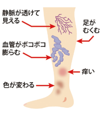
色素沈着や痒みなどの症状がある場合は積極的に受診を