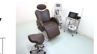
同院では患者さんの体への負担が少ない血管内レーザー治療を推奨