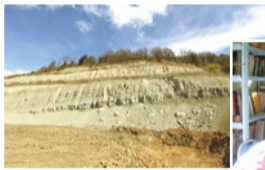
フランスにあるクレイ鉱山。環境保全なども考慮したうえで採掘者を選定している。