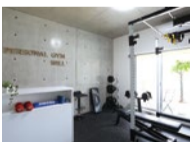
オシャレな空間でコロナ対策もバッチリ！シューズを預けられるので荷物が少なくいつでも行ける。

完全プライベート空間で、レベルの高い指導がマンツーマンで受けられると幅広い層が通うWILL。ダイエット結果が出なかった場合の結果保証や、子ども連れでも通えるので、ママさんや初心者の方でも始めやすい。毎日の食事管理もしてくれるので6週間で確実な結果が手に入る。安心でオシャレな空間で理想の身体を目指そう！