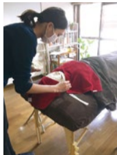
その他、石鹸講座や特別講座など多彩な講座あり。詳細、申込はWEBにて。

完全講座 8ヵ月 (月1回/1回4時間) エステサロンなどで活躍している方が必要とする基礎知識を得ることができるトータル講座を自宅で受講可能。自身のセルフケアに取り入れる方も多い人気の講座。