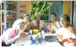
幅広い活用法がある「クレイ」の魅力を感じてみて！