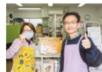
親切丁寧にやさしく教えてくれる先生たち。タイピングは「脳トレ」にも最適なのでシニアの方もぜひ。

タッチタイピング(キーボードを見ずに打つこと)をマスターして仕事の効率をあげよう! タイピングが上手になりたい方は同教室のタイピング特化コースがおすすめ。専用ソフトを使って基礎の基礎から学べて素早く正確なタイピング技術が習得できる。タイピング検定も随時受験できる。アットホームな雰囲気なので仲間と楽しみながら学べるのも大きな魅力。パソコンを効率よく活用したい方、ぜひ問い合わせを。