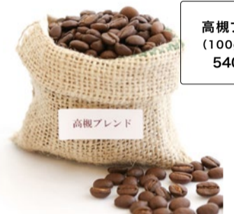
高槻ブレンド (100g) 540円(税込)

柔和な人柄の西田さん夫妻が開店から21年間、厳選した豆を毎日毎日店内で焙煎している専門店。今回紹介するのは、高槻生まれのスペシャルティコーヒー「高槻ブレンド(商標登録申請中)」。香り豊かで甘さの強いグアテマラをベースにじっくり丁寧に焙煎した逸品。その名前はお二人が大好きな高槻に感謝してつけたという。300g~の注文で送料無料となる、お得で便利なWEB購入がおすすめ。