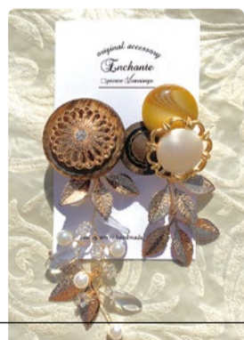
ハンドメイドアクセサリ 4,950円 ※ヴィンテージボタンは仕入れの状況により 変更の可能性あり

大切な方へのギフトやご自身へのご褒美としておすすめしたいのが Enchanteのハンドメイドアクセサリ。ピアス・イヤリングが中心で、デザイナーとして活躍中の大坪さんが一つひとつ制作している完全一点物。個性的なデザインだけど落ち着いた色合いで、服装やシーンを選ばず使えと多くのファンから支持されている。