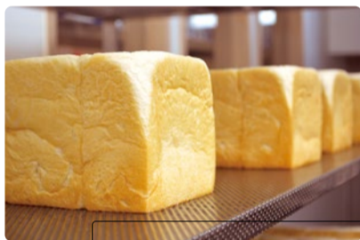
純生食パン 1本(2斤) 800円(税別)