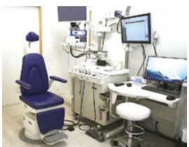
鼻専門家の同院は内服治療から手術に至るまで幅広い治療を提案します。