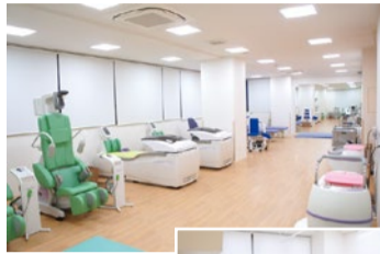
左、院内でリハビリテーション治療を受けることができます。設備も充実しています。