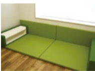
地下鉄御堂筋線・北大阪急行「千里中央」駅徒歩1分。キッズスペースも準備。

2月中旬からスギ、3月後半にはヒノキの花粉の飛散量が増えます。まずは検査をし、正しい原因を知ることから始めましょう。