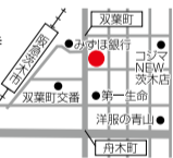
阪急茨木市駅すぐ