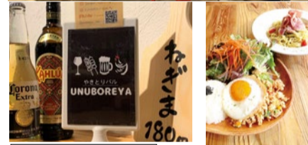
やきとりバル UNUBOREYA 4月中旬オープン予定!!

2019年のオープン以来「映え」カフェとして多くの女性に人気のUNUBOREYA。2周年となる今年は「やきとりバル UNUBOREYA」として4月中旬から夜の営業がパワーアップ。ユッケやピザ、おつまみ、串物と80種類を超える豊富なメニューが楽しめるようになる。お昼は変わらずカフェランチが楽しめるので、どんどん増えていく新メニューを食べにいこう!!