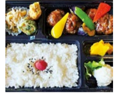
(上)シテイライフ読者限定でお得になる「いろは御膳」 (左)テイクアウトメニューも充実している。写真は、「和風肉団子弁当 650円」

季節を感じる旬の食材と、他では食べられない絶品の創作和食が楽しめる同店。3/1からスタートする人気の「いろは御膳」は、桜餅に仕立てた見た目も華やかな鯖の道明寺蒸しや帆立と筍のバター醤油和え、一度食べたらずみつきになること間違いなしの鶏の蒟蒻焼など豪華な内容。こちらが読者特典で500円引きでいただけるので、ぜったいオススメ!高槻市役所15階から眺める展望も好評。広々とした店内なので、ゆったりとお食事できる。