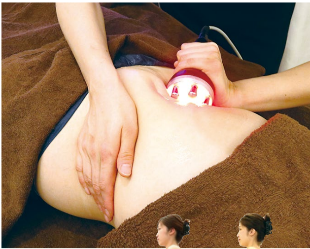
特殊超音波・ラジオ波・吸引・EMSで脂肪を徹底的に燃焼。

2ヵ月6回の施術で 体重は-11kg、 体脂肪は-8.7%も減少。 ウエストは驚異の-15cm。