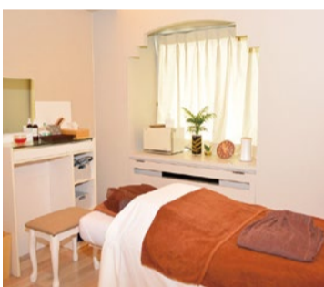
女性専用・感染対策もしっかりとした完全個室のプライベート空間。平日20時までだから仕事帰りもOK。