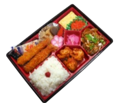
前日までの予約弁当「エビフライと焼肉弁当」1,280円(税込)

店のこだわりは、昆布・しいたけ・うめいわしから丁寧に作った「出汁」。しっかりと出汁の味をきかせた総菜は「出汁からとっているのがわかる」と常連客からも好評だ。米は季節に応じた最適なブレンドを使っており、「このお米が一番おいしい」との声も。弁当は「からあげ弁当」や「シヤケ弁当」など定番のものから、カレーや丼ぶり、ミニサイズのお子様弁当などバラエティ豊富に取りそろえる。中でも人気はワンコインの「だしまき弁当」。アンケートでもNo.1を獲得した「だしまき」をメインに、からあげ、ほうれん草、サラダなどが彩りよく並び、「毎日、卵80個分くらいは焼いています。う