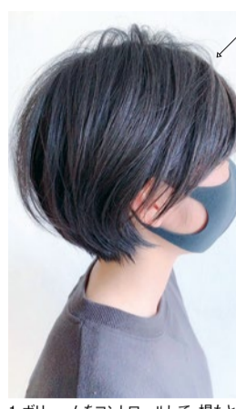
1.ボリュームをコントロールして、根もとから、ふんわり軽やかな髪へとみちびく