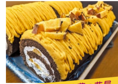
おいも 物販 五島商店 佐藤の芋屋 プレミアム安納芋ロールケーキ 長崎県五島の土壌をイメージし、それを再現するためにブラックココアをふんだんに使用しています。ケーキの上には有機安納芋ペーストをかけ、ふかし芋をトッピングしました。