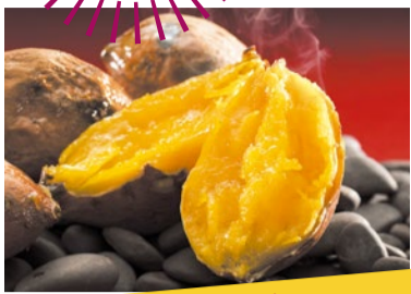
焼きいも おいもや 安納芋の焼き芋 鹿児島県 種子島産の熟成安納芋のしっとり甘い焼き芋です。