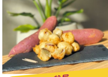
おいも FOOD 斧屋 斧のいもこ あつあつでも冷めても美味しいお芋の天ぷら。蒸し芋にほどよい甘さの衣がやみつきに。