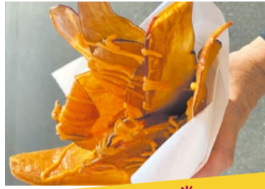
おいも FOOD カンロ堂 さつまいチップス パリッと心地よい音を立てて割れるチップスは、素朴な味でありながら噛む度に芋の甘さがふわっと広がります。