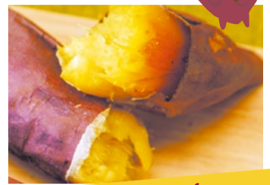
焼きいも LOHAS cafe 甘太くん(大分県産) 40日以上貯蔵することでツヤツヤの蜜が滲み出し、口含むと驚くほどのしっとりとした甘さが味わえます。常温でも冷やしても、また温めてもおいしくいただけます。