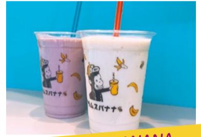
おいも FOOD CRAMSBANANA むらさきいもバナナジュース おいもバナナジュース おいもEXPO限定おいもバナナジュース!お芋の優しい甘味と食感が楽しめます!