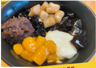
おいも FOOD KORI CAFE 芋園(ユウエン) 茹でた芋(タロイモ・サツマイモなど)をペースト状に潰し、食べやすい大きさにカット後、再度ゆでて完成。当日は、タピオカなどを添えてご提供いたします。