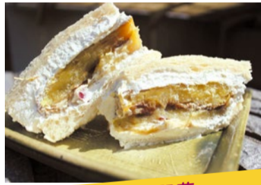
おいも 物販 芋と野菜 熟成蜜芋サンド 蜜たっぷりの焼き芋(品種 紅はるか)・あっさりした生クリーム・芋蜜・黒蜜・自家製芋餡が相まって口いっぱい幸せが広がります。