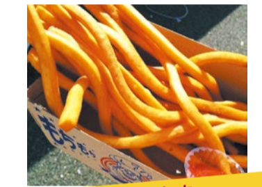
おいも FOOD ほりい商店 もちもちポテト もちもちポテトは、クネクネと長く独特の食感と何とも言えない絶妙な味わいで、ポテトへ伸ばす手が止まらないクセになる一品です。