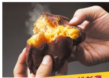
焼きいも 焼き芋専門店 維新蔵 焼き芋(さつまいライ) 100日間熟成させた糖度50度以上で皮まで食べれる濃密な焼き芋です。