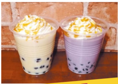
おいも FOOD cafe楽園 濃厚おいもミルクのタピオカドリンク 紅はるかを使ったおいもミルクに、黒糖に漬けたんだタピオカを合わせました。