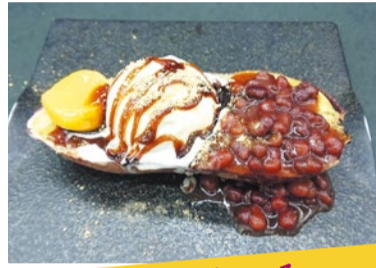
おいも FOOD 酒馳走こころ お芋パフェ 甘味の濃い紅はるかを低温で焼き上げ、アイス、あずき、栗甘露煮を添えた贅沢パフェ。黒蜜&きな粉でどうぞ!