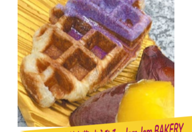
おいも FOOD 蔵出し熟成焼き芋 すえひろ x Jam JAM BAKERY おいもクロッフル バターを何層にも折り込んだクロワッサン生地をじっくり低温発酵させワッフルメーカーで焼き上げ、紫芋ホワイトチョコと特殊製法の焼き芋パウダーを使用しております。