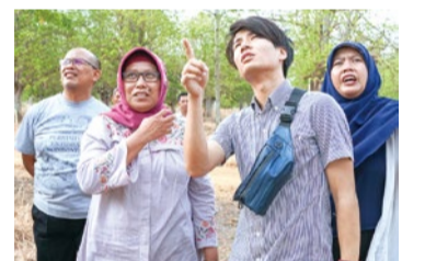
現地農園視察の様子。ブランドとして「Farm to Fashion」を掲げており、原料調達から商品が消費者に届くまでのプロセスを大切にしているという。

「気候変動に具体的な対策を」 高機能かつ付加価値のある商品を提供することで大量生産・大量廃棄に歯止めをかけ、廃棄の際に発生する二酸化炭素を抑える。