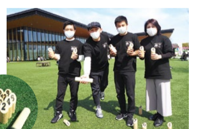
実際に使用するモルックとスコット

わとブームになりつつあるようです。青空の下、仲間と一緒にモルックを楽しむ人が増えることを願いつつ、たかつきモルック倶楽部は活動を続けていきます。