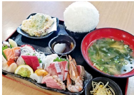
「銀蔵 特選お造り定食」(1,980円)天ぷら付き、小鉢、ご飯おかわり無料(ランチ時)。

テイクアウトで大人気の「銀蔵 特選海鮮丼」(2,180円)。イトインメニューの定食にすると、同料金のまま小鉢・あら汁付き。