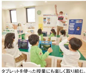
タブレットを使った授業にも楽しく取り組む。