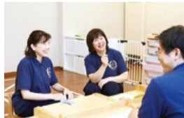
一人ひとりの子どもに合わせた、オーダーメイドカリキュラムを提供する。

(上)うまうまいなくても「前よりは上手だったね」など声をかけ、失敗はないという思いで褒める。小さな成功体験を積み、自己肯定感を育む。