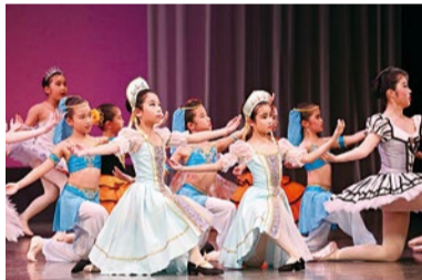
入会金無料/発表会は(毎年3月に)年に1回開催