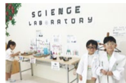
アウトプットの場として、サイエンスワークで自分たちの研究結果を発表。