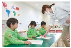
アイウィンでは母国語も大切にしているため、国語の授業が毎日ある。

アイウィンでは母国語も大切にしているため、国語の授業が毎日ある。STEAMの教育プログラム、アート&クラフト、算数)を設置して様々な経験を通して、自分で考える力や問題を解決する力を身につけていきます。そして、人と違うことはダメなことではない、自分