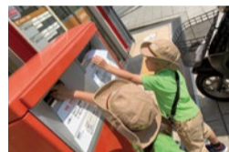
社会のしくみも、実際に体験することでリアルに身につけていく。

アイウィンインターナショナルスクールを運営するAll For Kids, Ltd代表。父は大学教授、母は幼稚園経営者という教育が身近にある環境で育つ。幼少期の教育の大事さを理解し、信念を持って子どもたちの可能性を広げるカリキュラムを展開している。