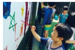
園庭を使って、思い思いのアートを楽しむ子どもたち。みんな夢中!!