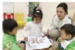
英語の絵本を年下のお友達に読み聞かせてあげること。