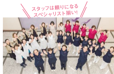
スタッフは頼りになるスペシャリスト揃い!