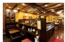
45年間変わらない店内はまるでタイムマシン。