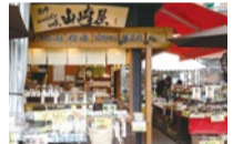
100年先まで続くようにと願いのこもった看板が今日もお客を出迎える。