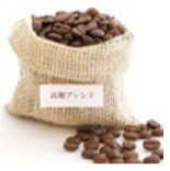
高槻生まれのスペシャルティコーヒー「高槻ブレンド(商標登録中)」。100g540円(税込)

自家焙煎コーヒー マウンテン 高槻市芥川町2-8-21 営/10時~19時 日曜定休 ☎072-681-2351 http://mountain1999.com/