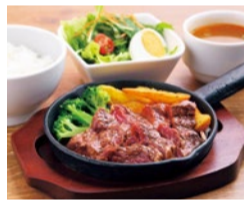
肉バルGABUTTO 茨木市西中条町1-1 ハタセViビル 1F