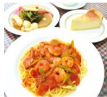
スパゲティレストラン マダム・アンスイ 高槻市高槻町12-13 ※画像はすべてイメージです

事前にご予約いただき、当日セミナーを受講された方には下記の店舗で使用できるグルメ券(1,000円分)をプレゼント。各店舗先着20名までとなります。以降はセミナー受講のみとなります。