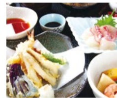
和ダイニング 四季彩々 高槻市芥川町1-10-30