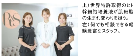
上)世界特許取得のヒト幹細胞培養液が肌細胞の生まれ変わりを担う。 左)何でも相談できる経験豊富なスタッフ。