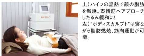
上)ハイフの温熱で顔の脂肪を燃焼。表情筋へアプローチしたみ緩みに! 左)「ボディスカルプト」は寝ながら脂肪燃焼、筋肉運動が可能。