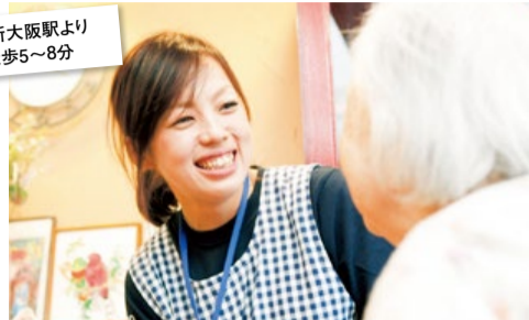
各コース申込開講日の40日前までにお申込みで受講料から10,000円割引!講座では実際に介護技術の体験もしていただけます。

今後ますます需要が増えていく介護のお仕事。全国で300ヶ所以上の高齢者向けホームを運営する当社開催の「ベネッセ介護職員初任者研修」では、各施設で活躍している現役スタッフを講師に、介護の基礎的な知識だけでなく、エピソードを交えた実践的な知識を身につけていただけます。受講料はご検討いただきやすい55,000円と通いやすいのもポイント。ご希望の方には、施設・在宅の仕事や、人材会社での仕事探しまで、資格取得後のバックアップも一人ひとりに合わせて手厚くサポートいたします。「未経験だけどこれから介護職に就きたい」「現在無資格で働いている」「親の介護に役立てたい」という人にオススメです。介護の魅力や講座で学べること、修了後の仕事など、気になることがあれば、まずは無料説明会へお気軽にご参加ください。