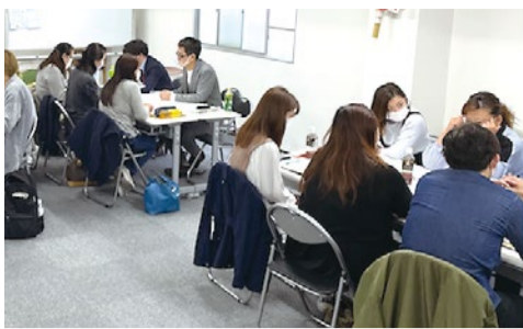
修了証は即日発行。総務省が今年1月に「スマホの相談員の資格制度を検討する」と発表したこともあり、人気の講習に。

今後、安くなると話題のスマホの通信費だが、「全然安くない」との声も多い。通信費の削減には知識が必要!キャリアショップでは中立的な知識が得られない中、適正なプランなどが選べるようになる「スマホマイスター検定資格」が話題。スマホの費用に月1万円以上支払っている人には特にオススメ。自分だけでなく家族全員の料金見直しのため、正しい知識を身につけて賢くプラン選択できるように。さらに通信費削減が取得でき副業としても活用OK。今なら講習費0円、教材費1,000円のみ。