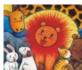
徳治昭さんは 童画家・イラストレーター 宝くじイラストや絵本、キャラ クターデザインなどで活躍。

わくわくデンタルグッズ先着30名様にプレゼント 虫歯予防デーわくわく親子フェスタ+徳治昭童画展 ●[日時] 6月12日(土)10時~14時 童画展は12日(土)~20日(日)11時~18時 ●[場所] 茨木市駅前4-3-26 (医)朝倉クリニック歯科ハッピークラブ 1F・2Fイベントホール フェスタの予約申し込み 072-626-2006 ①10時~②11時~③12時~④13時~ イベントについてのお問い合わせ 080-1510-5546 ※要予約 (主催)朝倉クリニック(春日丘本院)/ギャラリーあさくら