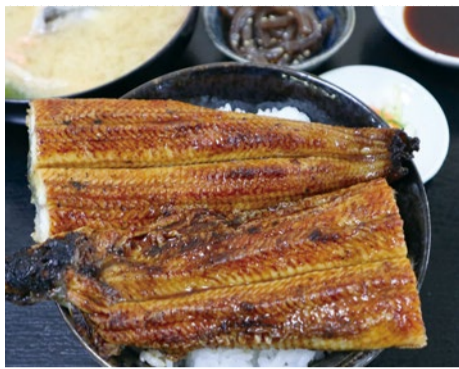
ボリューム満点の国産うなぎをご飯の上に豪快にのせた「国産うなぎ丼」(3,960円)。