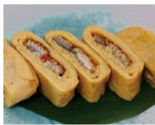
うなぎの旨味を十分に引き出した「自家製うなぎ」(858円)。食べ応え十分な一品。