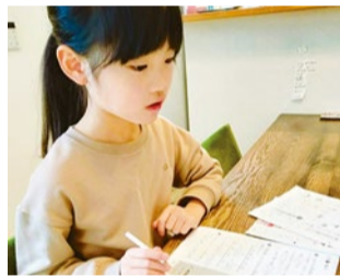
入学前準備としても最適な習い事。年少、年中から通う子も多い。

北摂エリアに約100教室ある学研で教えているのは、「解き方」ではなく「学び方」。楽しみながら自然と勉強習慣が身につく教材を使用しているの、夢中になってどんどん知識を吸収していくという。「学ぶよるこび」を知ることで、一生ものの「学びの土台」が育まれていく。すべての学習の基礎となる算数(数学)・国語に加えて、子どもの発達段階に合わせた教材で、無理なく効率的に「使える英語」の基礎をしっかりと身につけることができる英語コースを選択する子も増えているという。ただいま、夏の無料体験学習(算数・国語・英語)を受付中なので、お近くの教室を探してみたい方はいかがだろうか。