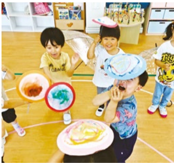
各曜日1時間の習い事「エデュタイム」で子どもの可能性を引き出すプログラムが特徴

知育、リズム、体操・体育、 絵画・造形、英語の5つの「エデュタイム」は、日本ベビーコーチング協会監修のレッスンタイム。