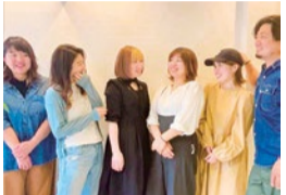
経験豊富なオーナーと女性スタッフが質の高い施術をしてくれる。

オーナーのマイナス5歳カットやオーガニックカラーなど本物志向に惚れ込んだ40代女性に人気の同店。経験豊富なスタッフが一人ひとりの悩みを解決してくれる。この夏誕生したヘッドスパはフルフラットになる特別なシートで、体に負担をかけず頭や首に溜まった疲れをスッキリさせてくれる。育毛効果も高いヘッドスパで元気になる。