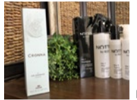
アイススパシャンプーの他にも高品質な商品を取り揃える。

紫外線や汗の影響で髪や頭皮が傷みやすい夏を快適に過ごせるように、人気の炭酸シャンプーメニューが登場。臭いやべたつきを上質なオレンジオイルで綺麗に洗い流してくれる。メントール配合の氷点下泡で夏の熱さも忘れられる。例年以上に暑くなりそうな夏を快適に乗り越えよう。