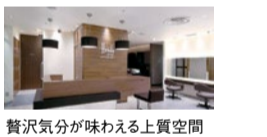
地肌が「シミやすい」、髪が「痛みやすい」とお悩みの方でも安心!

JR高槻駅直結、駐車場も完備している高槻阪急内にある創業1963年の実力派サロン。経験豊富なスタイリスト達が髪的美と健康をしっかりサポートしてくれると評判で、リピート率は90%以上。白髪染め等、先が長いカラーなのでダメージレスを重要視するという方は、オーガニック艶カラーがおすすめ。頭皮と髪のコンディションを良くして大人の品格が出るツヤ色に。ハリと艶のある美しいカラースタイルへと導いてくれる。