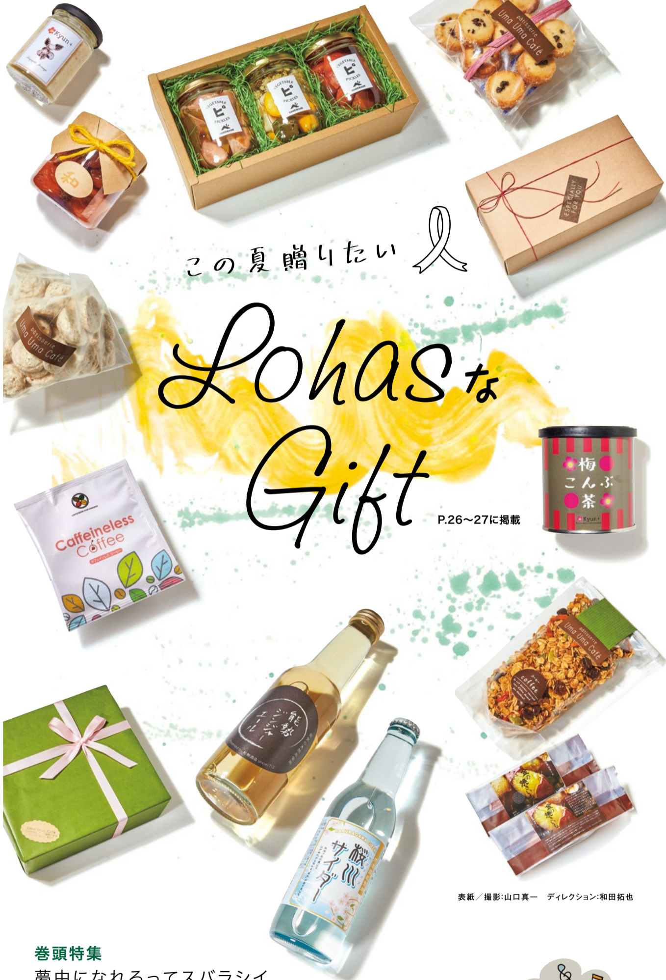
表紙 / ディレクション:和田拓也