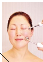
シミ・しわ・たるみ・ニキビ跡などには、“悩み特化型光フェイシャル”。加齢に伴う肉落ちをぐぐっと上げる“小顔リフトアップフェイシャル”。肌状態を見て貴女にぴったりのメニューを提案してくれる。