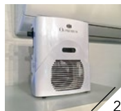
2.東京都の救急車に設置率100%の高除菌空気清浄機O3PREMIUMでしっかりウイルス対策。「換気するより安全」と言われるほどの殺菌力。

私のサロン 吹田市山田西4-16-5 営/10時~19時 7/16(金)・17(土)休み、 日・祝定休 カード利用可 ☎06-6875-1577