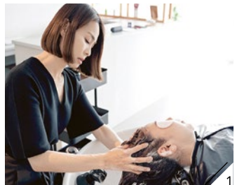
1.洗浄成分は一切使わず、贅沢美容クリームのお分だけで髪や頭皮の汚れをオフ。艶髪&抜け毛にも効果的。

北摂では珍しいバリ式ヘッドスパが受けられる同店。よくあるヘッドスパと違い、こり固まった頭・首・肩の筋肉をほぐして正常な位置に戻す手技。頭皮と顔は一枚皮のように繋がっているため、施術後は顔のリフトアップやトーンアップを実感する人も多い。頭皮のリンパを流し自律神経を整えるので、代謝が上がりデトックス効果も!慢性的な首肩こりや眼精疲労、抜け毛にお悩みの方はぜひ試してほしい。