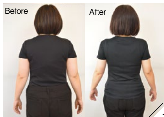
1.3ヵ月で-8キロ、お腹周り-11.9cmのHさん(48歳)。「運動なしで思いを全くせずに、不思議とどんどん痩せていきました!」