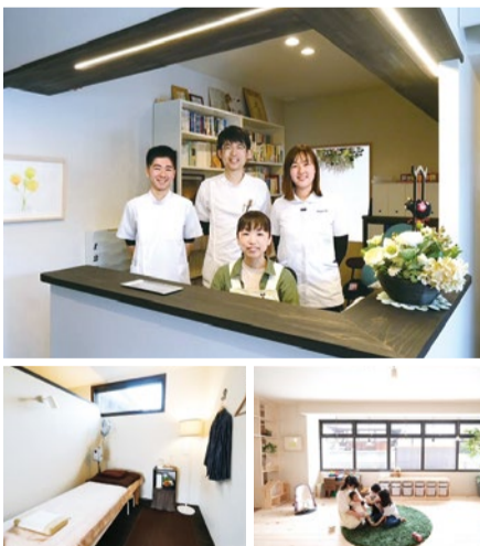
(右) 託児スペースがあるので、2人目妊娠をお考えの方も安心。 (左) 妊娠~産後~小児治療、すべてをお任せできる。

最近、関心が高まっている鍼灸やピラティスを取り入れた不妊治療。病院での治療に対しての不安や治療費の問題、身体への負担がその要因だという。高槻にある「高橋鍼灸院」では、その鍼灸治療とピラティスで人が本来持つ自然治癒力を高めて妊娠しやすい身体づくりをサポートしてくれると口コミで人気を呼んでいる。その効果を聞いて遠方から訪れる人も多いため。約3ヶ月~6ヶ月をめぐりに施術し、自然な状況で養生生活を送りながら週1回を目安に通院。ピラティスでは、適正な筋肉をつけて体のバランスを整え、血流の良い体を作るサポートもしてくれる。まずは一度相談してみてもいいだろうか。