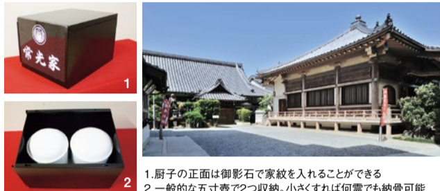
1. 厨子の正面は御影石で家紋を入れることができる 2. 一般的な五寸壺で2つ収納。小さくすれば何壺でも納骨可能

参拝ブースでカードをかざすと、遺骨収納厨子が運ばれて、扉が開くと御家のお墓になる。モニター画面で戒名や写真、映像を見ることが出来るため、故人の思い出を語りながら、ゆったりとお参りできる。