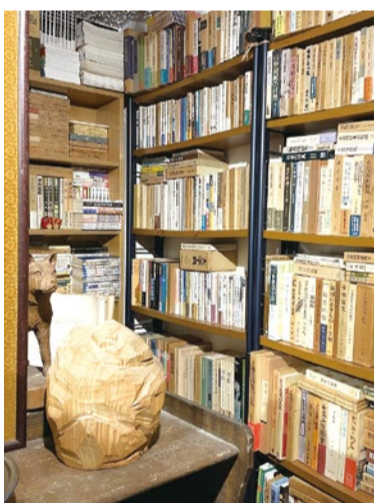
絶版になり、一般書店では入手困難なものを古書と呼ぶ。同店では、学術書・専門書を中心に、幅広い分野の古書を取り扱う。