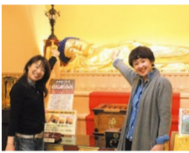
コロナ対策のため、予約制 毎日見学会開催中 (9時～17時)

さらに安心なのが永代供養してもらえると。「時が経ち、墓守りされる方がいなくなると、本堂前には供養塔(吹田市文化財の宝篋印塔)か舍利殿のご本尊である釈迦涅槃像の下に納骨いただけます。とくに釈迦涅槃堂はパワースポットとして色々な方がお参りされるお堂ですので、寂しくなく安心のお墓と