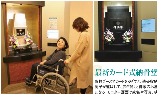
エレベーター完備。広々としたスペースで車いすに乗ったままお参りできる。