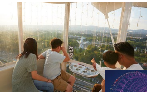
0~3歳は無料なので親子連れのリピーターも多い「オオサカホイール」。夜景もおすすめ。

夏休みに注目したいのはやっぱり「エンタメゾーン」。まずは、生きているミュージアム「ニフレル」を紹介しよう。ホワイトタイガーが頭上を通ったり、テッポウウオがエサを撃ち落としたりと、非日常が体験できるニフレル。館内は8つのゾーンに分かれていて、鮮やかな「いる」、生き抜くために身につけた驚きの「わざ」など、生きものの個性を独自の目線で切り取っている。特に子どもに人気なのは、「うごぎにふれる」ゾーンだ。真横をカピバラやワオキツネザルが歩いていたり、目の前でクジャクが羽を広げたり。「うちの子