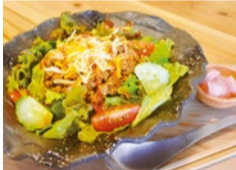
茨木産のセロリやたまねぎを使った、タコライス。辛味に爽やかさがプラスされたソースは今の季節にぴったり!

地元茨木の里山で採れた野菜やお米を使ったカラダに優しく美味しい食事が人気の同店。季節にあわせて食材が変わる看板メニューの「satonoごはん」は、クリーミーな青じそマヨがかかった国産鶏の焼き唐揚げや、手ごねハンバーグなどからメインのおかずが選べる。また、新登場のオレンジジュース、レモン汁、ケチャップをブレンドした辛味と爽やかさがプラスされた自家製ソースが美味しい「タコライス」もぜひ味わってほしい一品。キレイな見た目と贅沢な味わいの夏季限定パフェは、マンゴー、チョコ、抹茶ティラミスとバラエティ豊富。お盆期間も休まず営業しているので、ぜひ味わってみて!