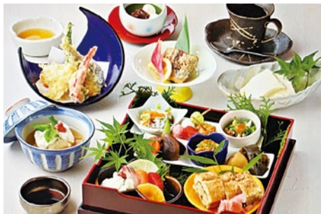
鯉押し寿司 / 鯉の道明寺蒸し / 口取りプレート / お造り盛り合わせ / 自家製汲み上げ豆腐 / 天ぷら盛り合わせ / 吸い物