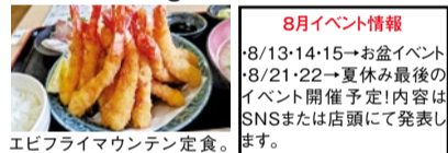
エビフライマウンテン定食。1,680円店内飲食。

8月のおすすめは、夏のエネルギー源「鯉井」に合わせ、旬な食材を使った5つのスタミナメニューからもう一品を選ぶ「スタミナW定食」。選べるのは、明石たこの刺身・天ぷら、活けめの鯉湯引き・天ぷら、国産穴子の天ぷらの5つ。激安の朝市「オロイチ」は8月21日(土)がサックス箕面店、小野原本店が28日(土)に開催!内容は公式Instagramで発表。