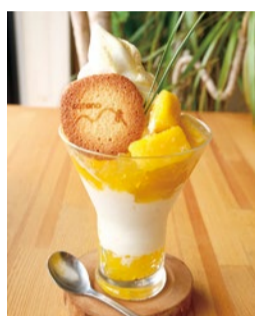
冷たい角切りマンゴーにとろ〜り濃厚ココナッツプリンが入ったぜいたくな「マンゴーココナッツパフェ」