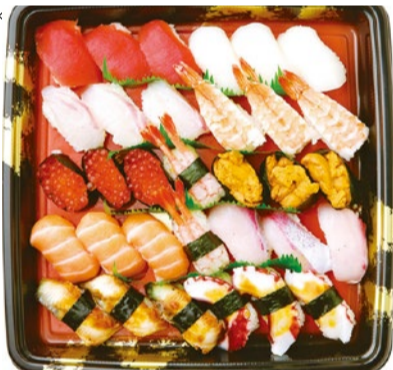
魚屋のにぎり寿司<竹>