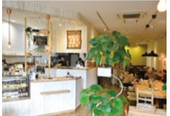
ゆったりとお食事ができる広々とした店内。里山の四季が感じられる、ほっこりとした雰囲気