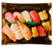
特上のにぎり寿司 1人前

モリタ屋の魚屋のお寿司はいかが? おすすめは魚屋のにぎり寿司「竹」。上質なネタをたっぷり使った豪華な握り寿司だ。4日前までの予約が必要。その他、好みや予算に合わせた盛り合わせもオーダー可。詳細はサービスカウンターにて。