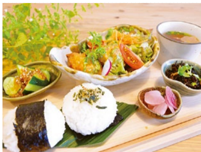
「satonoごはん」のメインのおかずは3種類から選べる