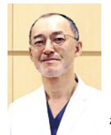
このドクターに聞きました

お悩み・01 朝起きた時、手の指がこわばっていて少し腫れているのですが、何か病気でしょうか? 30代Mさん