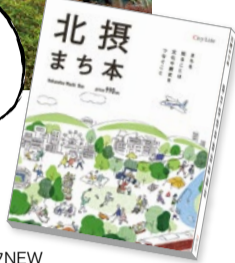
「北摂まち本」 定価 990円 編集・発行 株式会社シティライフNEW