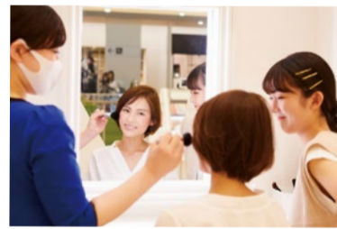
関西初出店となるコスメショップ「NARCIS」は、ラグジュアリーブランドのカラメイクを中心に、スキンケアも取り揃える。

ららぽーとEXPOCITYでは、ファッションや健康・美容、コスメのほか、日常生活に欠かせない多種多様な店舗が集結。梅田や心斎橋まで行かなくてもここに来れば何でもそろっているので、とても便利。子どもが幼稚園に入園した時は、ナフキンや給食セットなどもお気に入りが見つかりました」と 今年のは夏はエキスポシティで楽しもう! ※新型コロナウイルス感染症拡大防止のため、ご来館の際はマスクの着用をお願いいたします。