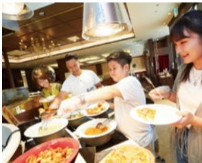
(左)広々としたフードコート「FOOD PAVILION」は、キッズ向けの席などさまざまなタイプの席がある。 (右)世界各国の料理をビュッフェスタイルで楽しめる「BUFFET RESTAURANT Atlantic」。