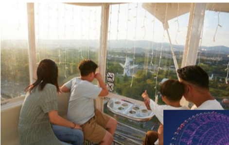
0~3歳は無料なので親子連れのリピーターも多い「オオサカホイール」。夜景もおすすめ。

夏休みに注目したいのはやっぱり「エンタメゾーン」。まずは、生きているミュージアム「ニフレル」を紹介しよう。ホワイトタイガーが頭上を通ったり、テッポウウオがエサを撃ち落としたりと、非日常が体験できるニフレル。館内は8つのゾーンに分かれていて、鮮やかな「いる」、生き抜くために身につけた驚きの「わざ」など、生きものの個性を独自の目線で切り取っている。特に子どもに人気なのは、「うごぎにふれる」ゾーンだ。真横をカピバラやワオキツネザルが歩いていたり、目の前でクジャクが羽を広げたり。「うちの子